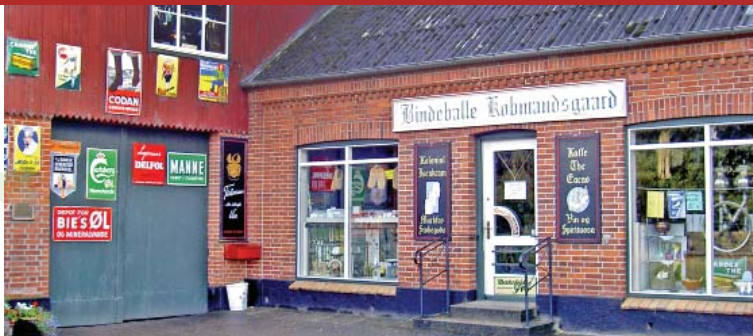
Bindeballe Købmandsmuseum ligger lige over for stationen

og investering i nye motorvogne var banen tæt på at blive nedlagt i 1930'erne. Men 2. verdenskrig gav nye store transportopgaver, og der med fornyet livskraft til banen, der efter krigen fik kraftigere skinner og nye skinnerbusser.