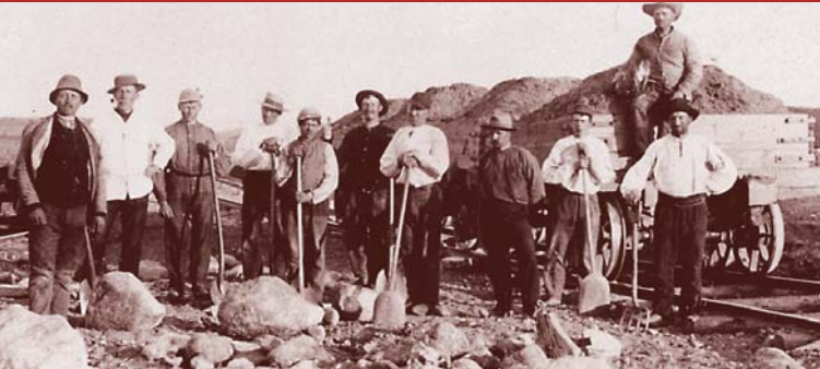
Anlægsarbejde ved Bindeballe ca. 1896.