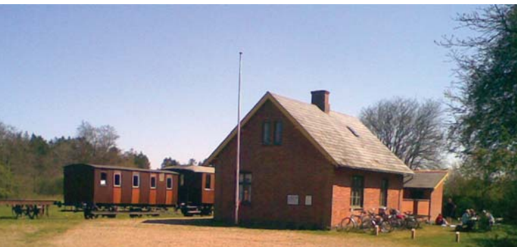
Bindeballe Station i dag