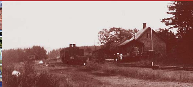
Bindeballe holdeplads ca. 1939

Den 2. maj 1944 blev stilheden imidlertid brudt, af braget fra to tog, der stødte sammen på stationen. Takket være personalets snarrådige indsats blev den helt store kata-